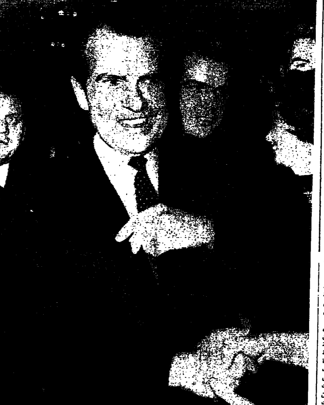
رشارد نيكسون الذي تحدث الانجاس من احتمال نجاحه كمرشح للحزب

لغوس - رويت - حارل جومون من تلايئة طالب جيمي شق طريقه الى